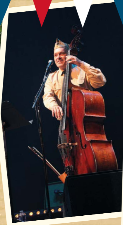
Les D-Day Ladies & leur band ! Fabuleux !