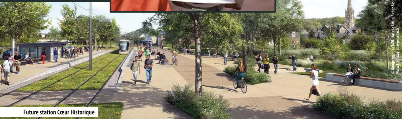
Future station Cœur Historique