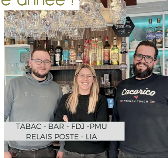
TABAC - BAR - FDJ - PMU RELAIS POSTE - LIA