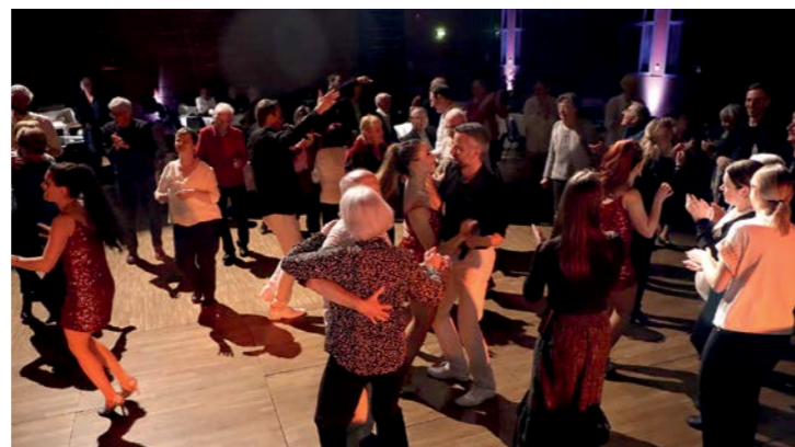
Spectacle en deux parties sur le thème du tour du Monde, suivi d'un bal pour terminer la journée en beauté.