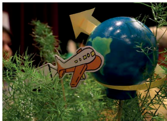
Décoration réalisée par les anciens à la Résidence des 104 lors des ateliers de préparation.

Emo Renée, 11 avril 1922, 101 ans et 10 mois Brengharth Marcel, 4 avril 1934, 89 ans et 11 mois